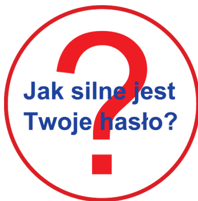
Rysunek 1. Grafika

Witryna internetowa wykorzystuje grafikę, którą należy przygotować i jest ona zgodna z rysunkiem 1.