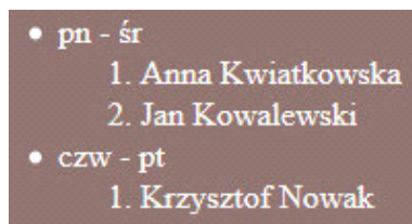
Obraz 3. Lista zagnieżdżona