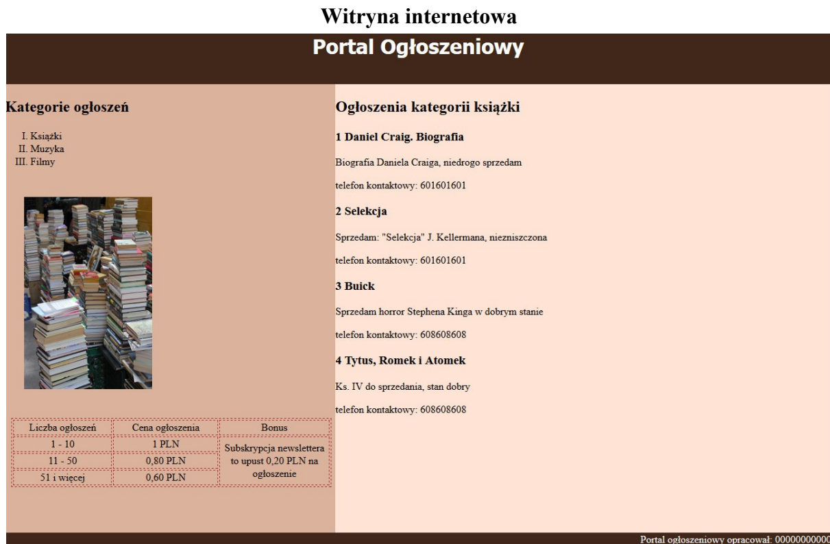
Obraz 2. Witryna internetowa