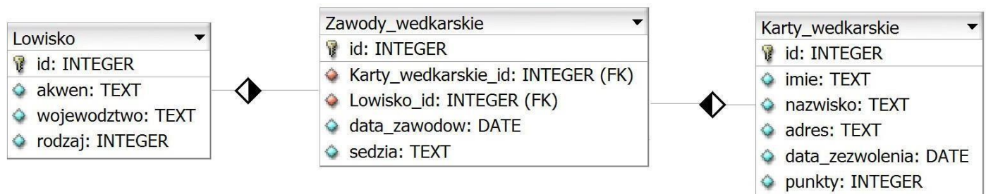
Obraz 1. Baza danych

Fragment bazy danych jest zgodny ze strukturą przedstawioną na obrazie 1. Tabela Zawody_wedkarskie jest połączona relacją z tabelą Lowisko (opisuje łowisko, gdzie będą się odbywać zawody) oraz tabelą Karty_wedkarskie (opisuje wędkarza, który wygrał zawody). Tabela Lowisko zawiera pole rodzaj, którego wartości oznaczają: 1 – morze, 2 – jezioro, 3 – rzeka, 4 – zalew, 5 – staw