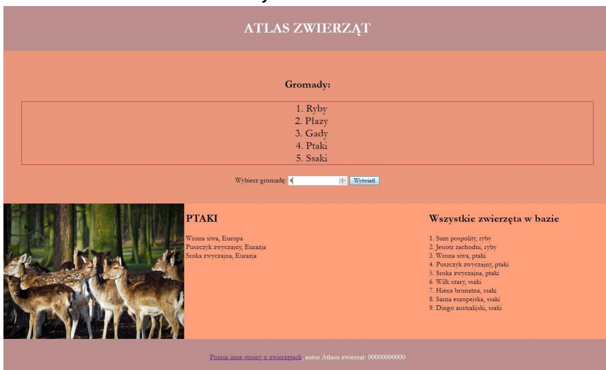
Obraz 2. Witryna internetowa