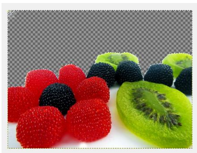
Obraz 1a. Przezroczystość zdjęcia cukierki1

Zdjęcie cukierki3.jpg należy przeskalować do rozmiaru 533 px na 400 px