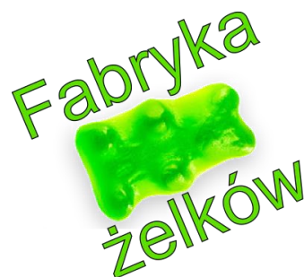
Obraz 1b. Logo