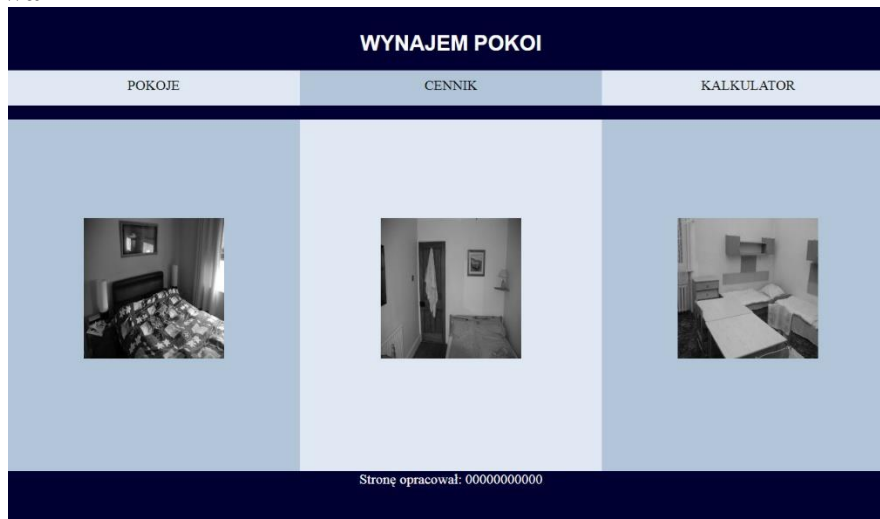
Obraz 2. Podstrona index.html

Strona składa się z plików index.html , cennik.php , kalkulator.html . Cechy wspólne wszystkich stron: