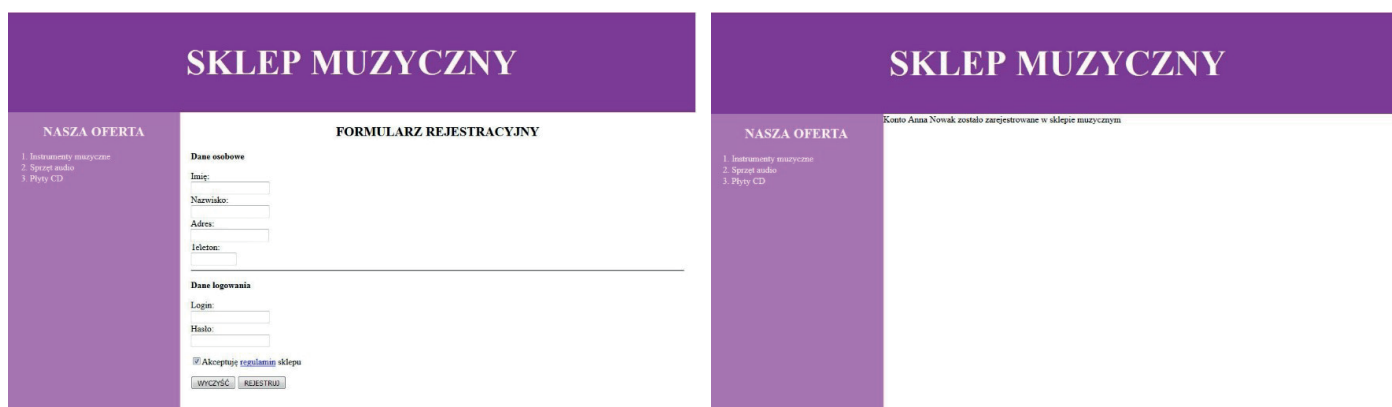
Rysunek 2. Witryna internetowa, strony sklep.html oraz formularz.php