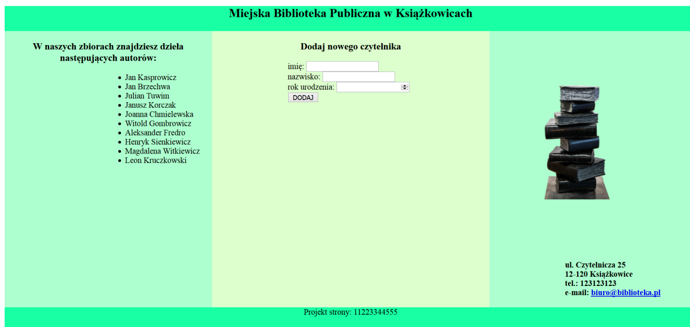
Obraz 2. Witryna internetowa