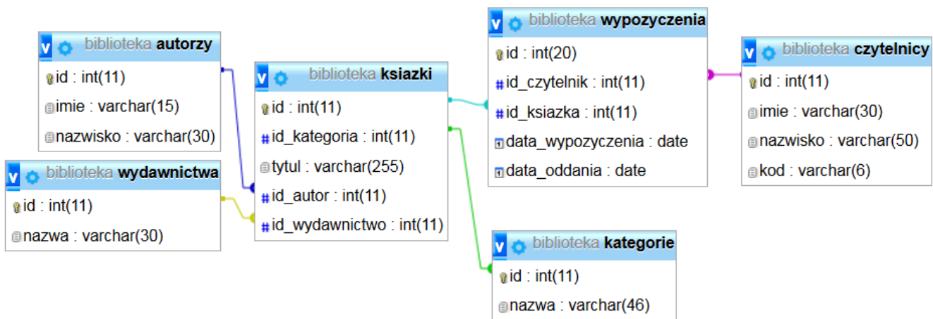
Obraz 1. Baza danych

Tabele w bazie biblioteka wykorzystane w zadaniu przedstawione są na obrazie 1.