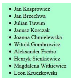
Obraz 3. Lista punktowana (nieuporządkowana) w bloku lewym