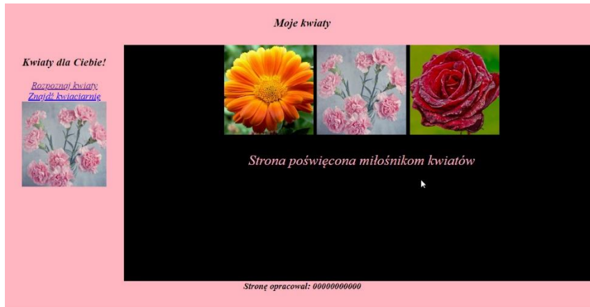
Obraz 1. Strona index.html

Witryna internetowa składa się ze stron index.html i znajdz.php . Strony zawierają wspólne elementy: