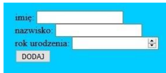
Obraz 4. Zawartość formularza w bloku środkowym: dwa pola tekstowe, jedno pole numeryczne oraz przycisk