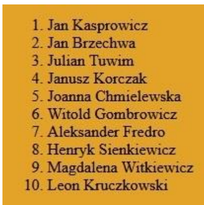
Obraz 3. Lista numerowana w bloku prawym