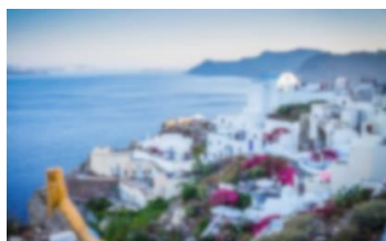
Obraz 1b. Po rozmyciu