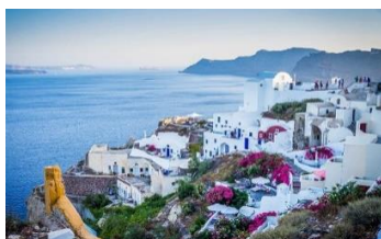
Obraz 1a. oryginalny obraz