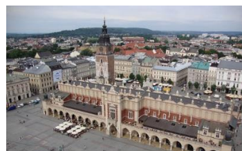
Obraz 1c. Po odcięciu dolnej części obrazu