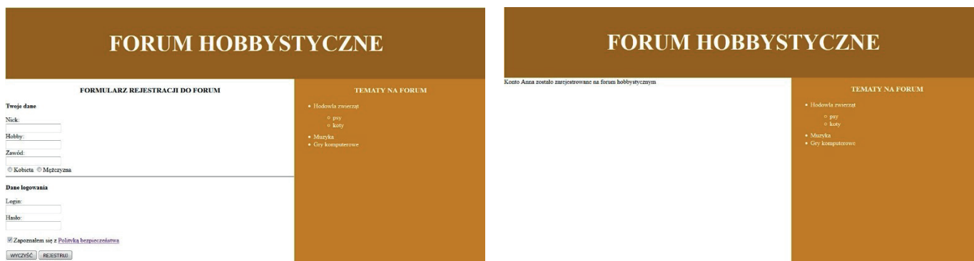
Rysunek 2. Witryna internetowa, strony forum.html oraz rejestracja.php