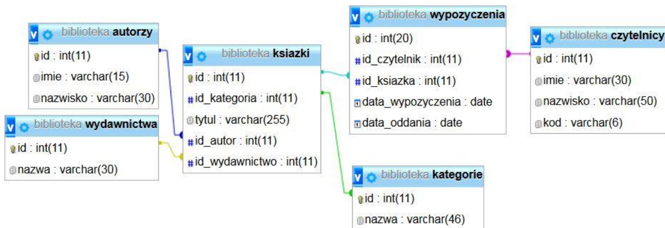
Obraz 1. Baza danych

Tabele w bazie biblioteka wykorzystane w zadaniu przedstawione są na obrazie 1.