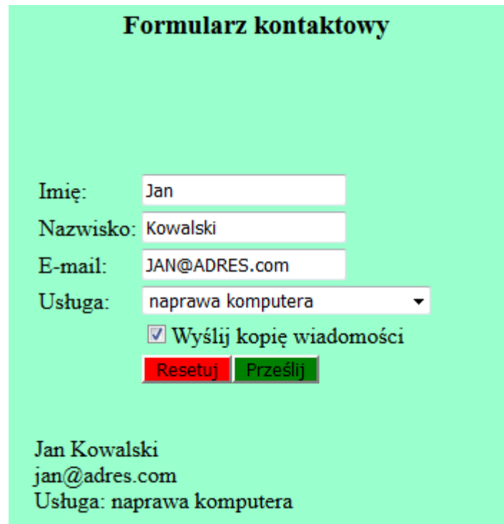
Obraz 3. Formularz