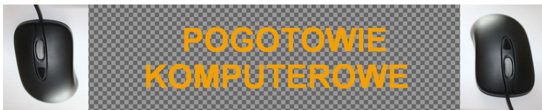
Obraz 1b. Baner z przezroczystością