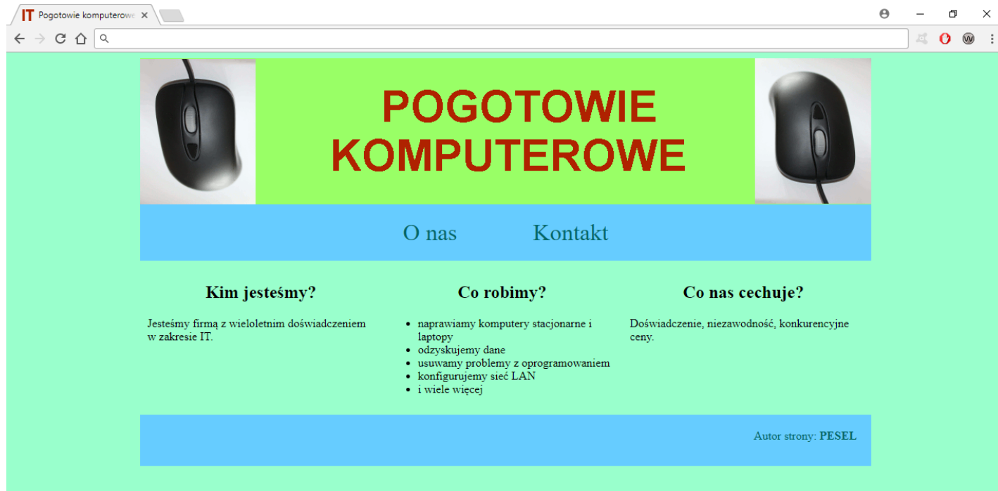
Obraz 2. Witryna, strona główna