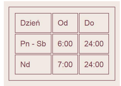
Obraz 2. Tabela z pliku stacja.html