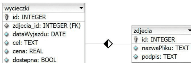
Obraz 1. Tabele wycieczki i zdjecia

Do wykonania zadania należy użyć tabel wycieczki i zdjecia przedstawione na Obrazie 1. Wycieczka jest dostępna, jeśli pole dostepna przyjmuje wartość TRUE