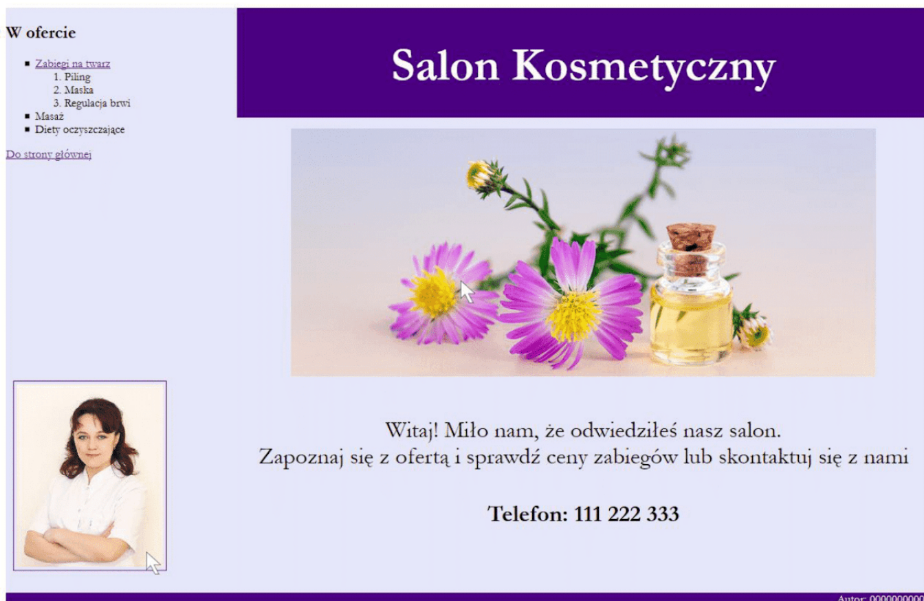
Obraz 2. Witryna internetowa, strona index.html , kursor znajduje się na obrazie po lewej stronie