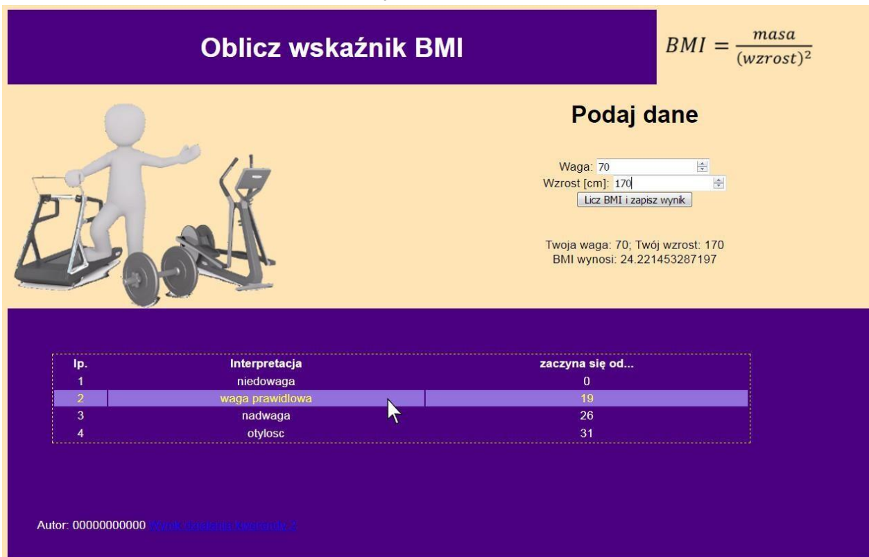
Obraz 2. Witryna internetowa, kursor na trzecim wierszu tabeli, zmienił się kolor tła i czcionki