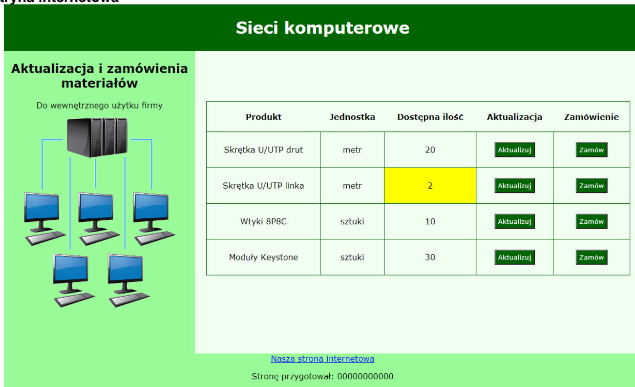
Obraz 2. Witryna internetowa. Stan początkowy