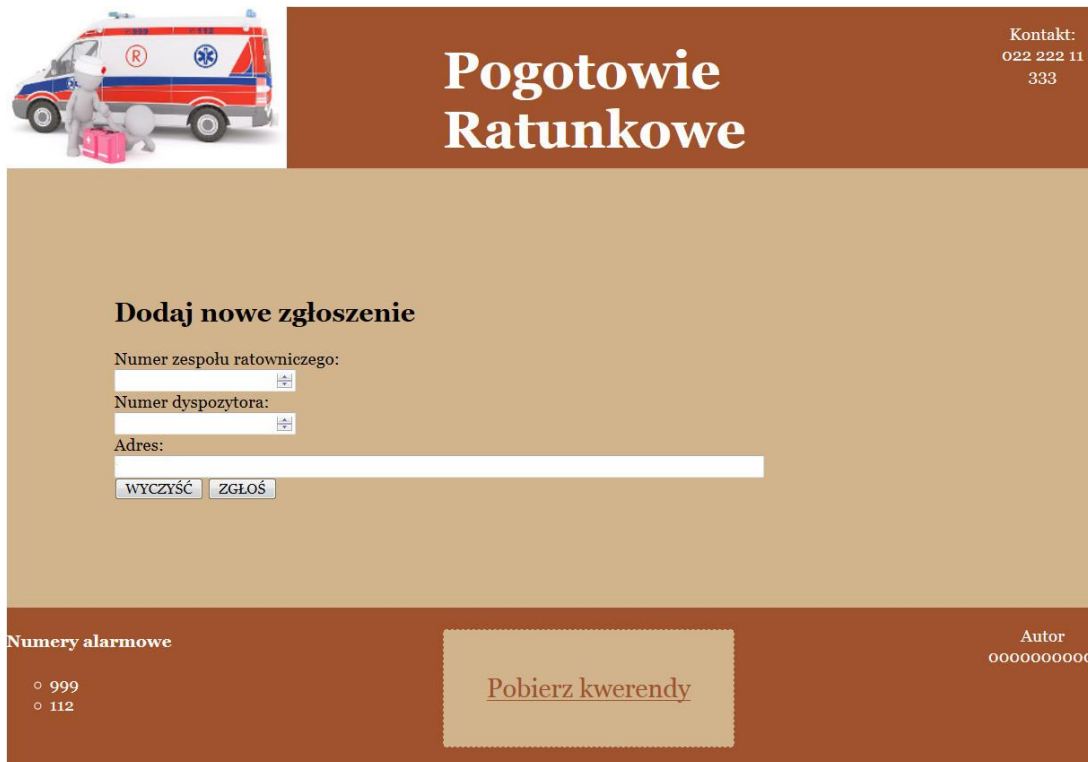
Obraz 2. Witryna internetowa