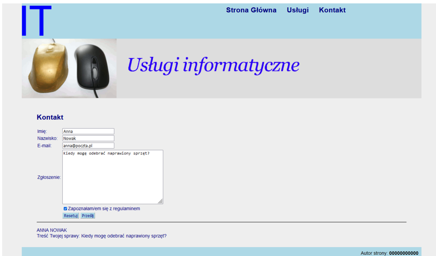
Obraz 3. Witryna, strona kontakt.html