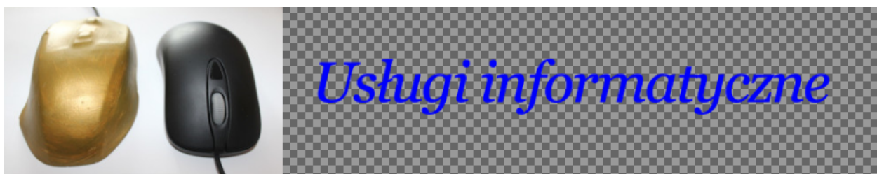
Obraz 2a. baner1