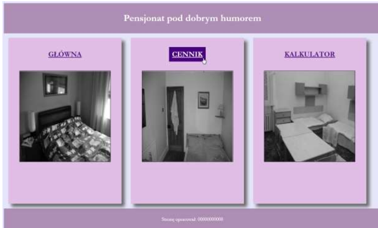
Obraz 2. Strona index.html , kursor znalazł się na odnośniku CENNIK