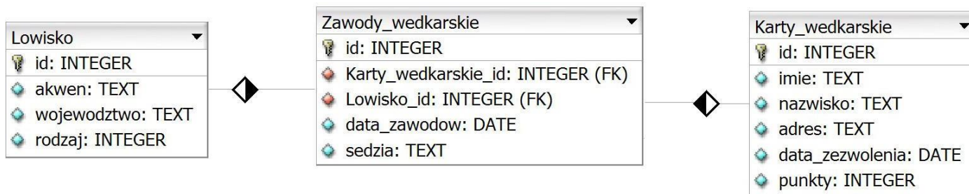
Obraz 1. Baza danych

Fragment bazy danych jest zgodny ze strukturą przedstawioną na obrazie 1. Tabela Zawody_wedkarskie jest połączona relacją z tabelą Lowisko (opisuje łowisko, gdzie będą się odbywać zawody) oraz tabelą Karty_wedkarskie (opisuje wędkarza, który wygrał zawody). Tabela Lowisko zawiera pole rodzaj, którego wartości oznaczają: 1 – morze, 2 – jezioro, 3 – rzeka, 4 – zalew, 5 – staw