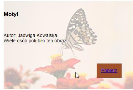
Obraz 3. Skrypt 1, kursor znajduje się na bloku, co powoduje zmiany w przezroczystości elementów