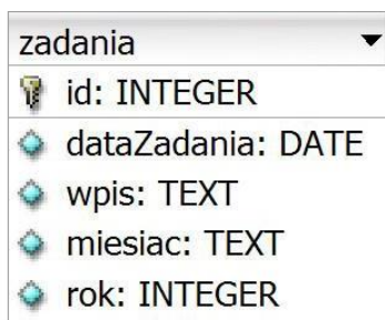
Obraz 1. Tabela zadania

Do wykonania zadania należy użyć tabeli zadania przedstawionej na obrazie 1.