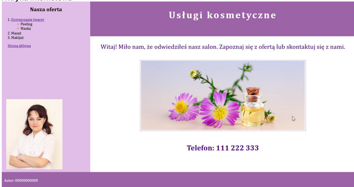
Obraz 2. Strona index.html , kursor znajduje się na obrazie po prawej stronie