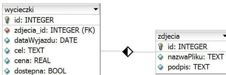
Obraz 1. Tabele wycieczki i zdjecia

Do wykonania zadania należy użyć tabel wycieczki i zdjecia przedstawionych na Obrazie 1. Wycieczka jest dostępna, jeśli pole dostępna przyjmuje wartość TRUE