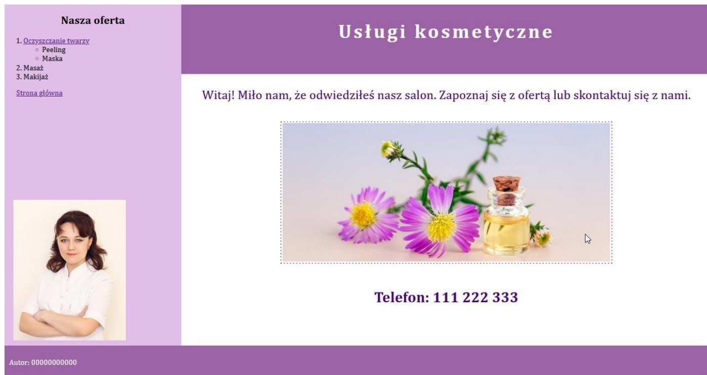
Obraz 2. Strona index.html , kursor znajduje się na obrazie po prawej stronie