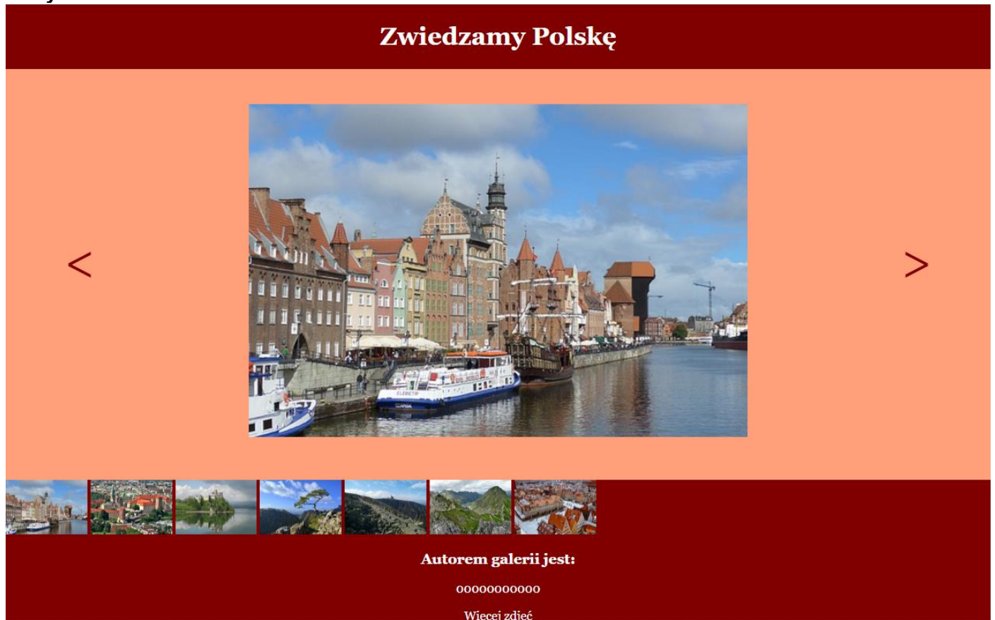
Obraz 2. Witryna internetowa.