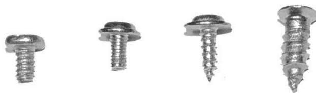
A. B. C. D.